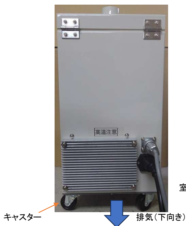
<外観> 室内排気タイプ(通常)